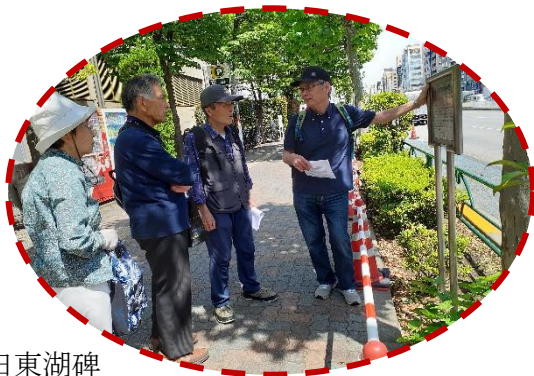
藤田東湖碑 前での説明

JR水道橋駅 → 藤田東湖碑 → 六角家跡 → 小石川後楽園 (入園・昼食) → 三崎三座 → キングスレー館 → 新島襄生誕地 → 錦輝館跡 → 山本宣治暗殺現場 → 救世軍 → 神田キリスト教青年会館跡 → 共立学校跡 → ニコライ堂 → JR御茶ノ水駅 (現在住友不動産神田ビル) (解散)